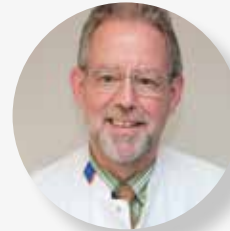
Arts op de Spoedeisende Hulp