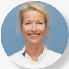
Spoedeisende Hulp verpleegkundige